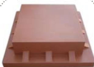
Πλαστικό πλαίσιο προσαρμογής για καπάκι Δ/Ξ