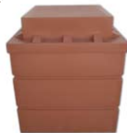
Σετ πλαστικού φρεατίου