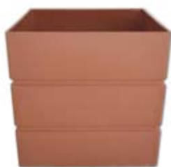
Πλαστικό στέλεχος φρεατίου